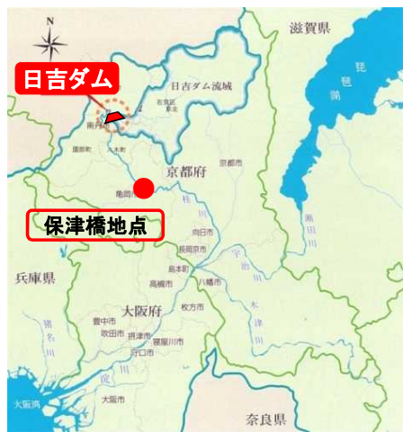
日吉ダムと保津橋地点の位置図