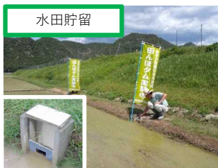
水田貯留 明石市等