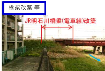
橋梁改築等 JR明石川橋梁(電車線)改築