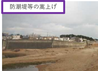
防潮堤等の嵩上げ