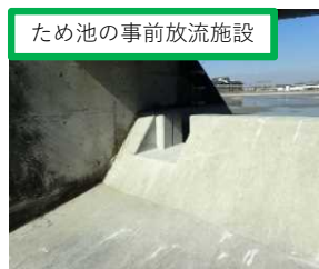
ため池の事前放流施設 江井ヶ島皿池（明石市）等